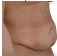
BMI tab fra 40 til 22